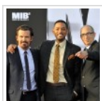
Italia: il botteghino del week end 25-27 maggio 2012