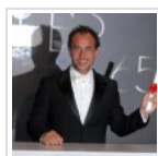
Il Gran Prix di Matteo Garrone