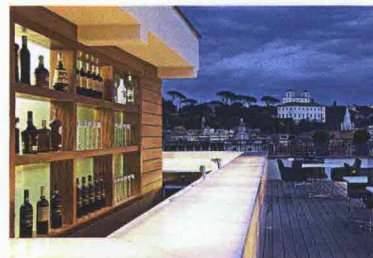
La terrazza dell'hotel The First.

terrazza del The First , hotel di design vicino a piazza del Popolo, dove si gustano freschissimi sushi e sashimi, nigiri e uramaki del risto japan Somo (via del Vantaggio 14, tel. 06.45.61.70.70) con un panorama fantastico sulla città. Da Moli , neotrattoia molisana a Testaccio, si va per mangiare all'aperto le polpette cacio e uova con cottura al cocco, oppure un'insalata di seppie con crudo di carciofi e sfoglie di pecorino del caseificio molisano